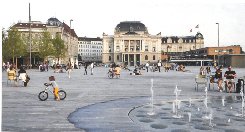
Am Tagungsort: der nach Plänen der Landschaftsarchitekten vetschpartner umgestaltete Sechseläutenplatz in Zürich.

Wann: 21. 9. 2017, 9.15–17.00 Uhr Wo: Sechseläutenplatz 10, Zürich (Brasserie Schiller und Hauptsitz der NZZ). Kosten: SIA-Mitglieder 100 Fr., Nichtmitglieder 200 Fr. Info und Anmeldung: www.sia.ch/mehralsgestaltung