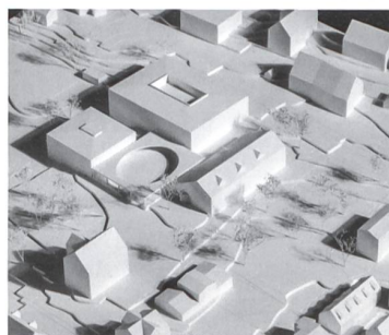
4. Rang / 3. Preis: «Rosso», Fiechter & Salzmann Architekten.