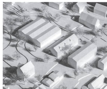
2. Rang / 2. Preis: «Dreisprung», Menzi Bürgler Architekten.

Besonders auffällig bei «Rosso» ist die Überdachung des Pausenhofs. Sie verbindet das bestehende Schulhaus Gramatt und die zwei Neubauten Primarschule und Turnhalle mit Tagesstrukturen. Formal und funktional überzeugt der Pausenhof jedoch nicht. •