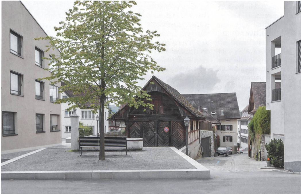
Stadteingang und Freiraum: Mit der Gewerbe- und Wohnüberbauung Mühle von Graber & Steiger Architekten wurde sowohl die Stadtmauer nach aussen in einer zeitgemässen Form ergänzt als auch nach innen der öffentliche Platz gefasst und gestaltet. In diesem Zusammenhang wurde auch das historische Spritzenhäuschen renoviert.

S tolz präsentiert sich die Luzerner Kleinstadt Sempach anlässlich der Preisübergabe des diesjährigen Wakkerpreises. Bei einem Stadtspaziergang wird schnell klar: Hier werden vorhandene Werte gepflegt, und gleichzeitig entstehen Neubauten, die einen Beitrag zur besseren Lebensqualität vor Ort leisten können.