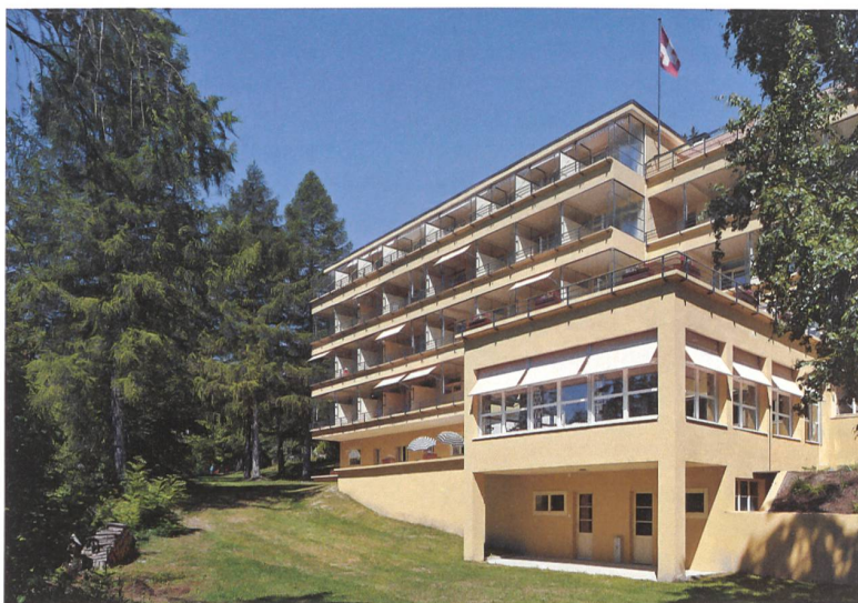
Wie im Originalzustand: die ockerfarbig verputzte Jugendherberge «Bella Lui».

Die Modernisierung begann im Oktober 2016; sie umfasste die historische Aufbereitung der geschützten Bausubstanz. Zudem wurden für den Jugendherbergsbetrieb erforderliche Elemente ergänzt. Das Architekturbüro Actescollectifs aus Sierre ging mit viel Feingefühl an die Erneuerung der Historie und belies die schöne Patina. «In enger Zusammenarbeit mit der Denkmalpflege konnten die ursprüngliche