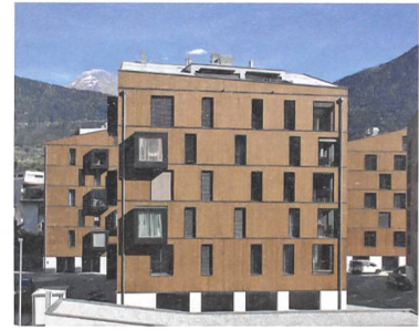
Aletsch Campus in Holzmodulbauweise.

Im Kern der Unesco-Welterbestätte «Jungfrau-Aletsch» befindet sich zwar ein schmelzender Gletscher. Zur Hauptsache besteht die spektakuläre Hochgebirgslandschaft zwischen dem Berner Oberland und dem Wallis allerdings aus Stein und Holz. Dieselbe Materialisierung trägt auch die gemischte Zentrumsüberbauung «Aletsch Campus» in Naters VS zur Schau, die das World Nature Forum sowie fünf Wohngebäude umfasst. Das kompakte Hauptgebäude mit dem Unesco-Zentrum bildet das mineralische Schwergewicht und ist von oben bis unten verputzt. Die Nachbarhäuser sind auf Sockelstelzen in hybrider Holzbauweise konstruiert. Gemeinsam mit den angedeuteten Satteldächern wird so an das Erscheinungsbild der Oberwalliser Bautradition erinnert. Die Holzbautechnik ist dennoch industriell geprägt: Die Fassa-