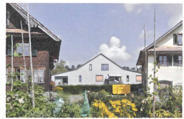
Neues im Weiler: Das Einfamilienhaus von Kunz Architekten ordnet sich subtil ins Ortsbild ein und bleibt doch ein eigenständiges und modernes Element.

Weitere Infos und Bilder unter www.espazium.ch/wakkerpreis-2017