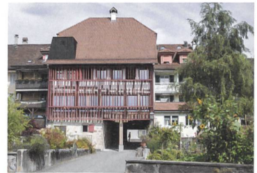
Bestehende Werte klug nutzen: Das spätmittelalterliche Rathaus von 1474 wurde zum Museum umgenutzt. Umbau und Restauration: Gerold Kunz (Konzept), A6 Architekten (Umsetzung).