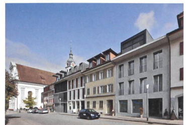
Den Rhythmus aufnehmen: drei neue Wohn- und Gewerbehäuser in der Altstadt von Rigert Bisang Architekten, Unit Architekten und Rainer Heublein.