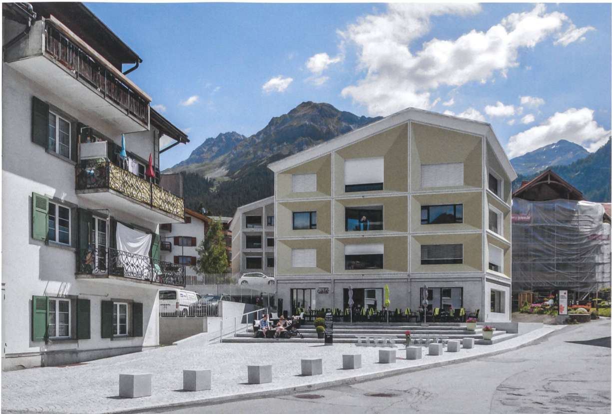
Die Wohn- und Geschäftshäuser neueren Datums sorgen, mitten im kommerziellen Zentrum der Lenzerheide, erstmals für kleinstädtisches, lebendiges Flair («Senda», Architektur: Ritter Schumacher, Chur; Bauingenieur: ewp, Chur; Baujahr: 2016).