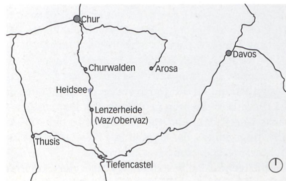
Situation, Mst. 1:500000.

In Sichtweite davon hat das Büro auch den Bushof realisiert, mit ebenso ausgeprägtem Materialisierungscharakter. Die alte Postautohaltestelle an der