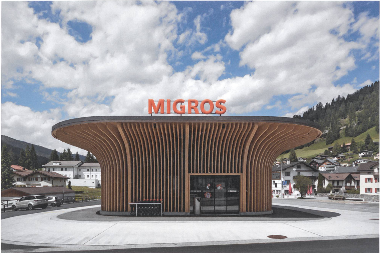
Das neue ÖV-Terminal von Churwalden: In Laufristanz zur Bergbahn ist ein multifunktionaler Pavillon mit Warteraum und Einkaufsladen entstanden (Architektur: Ritter Schumacher, Chur; Holzbau: Frommelt, Schaan; Baujahr: 2016).