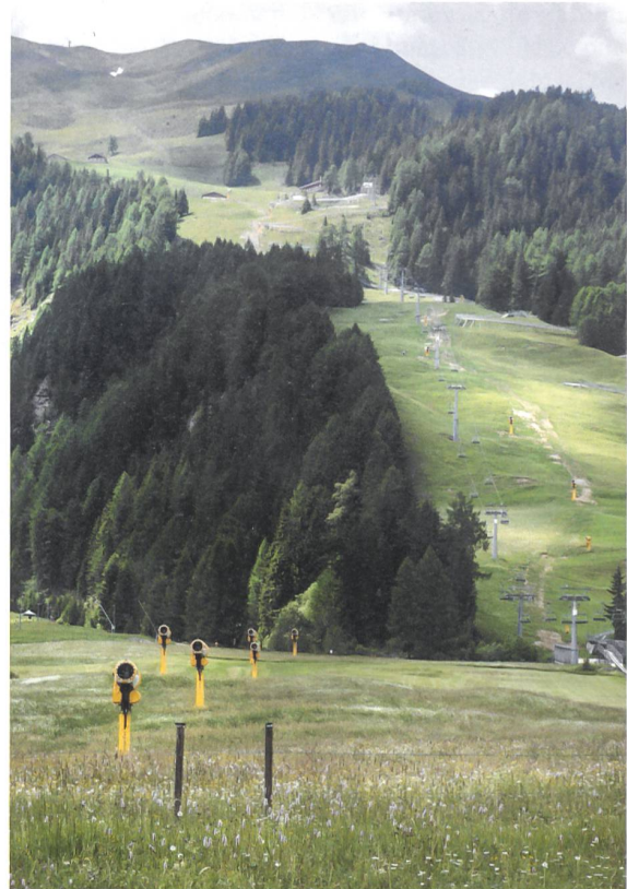
Spuren in der Landschaft und hoher Energiekonsum: Wie nachhaltig ist eine Skidestination? (Blick auf Pradaschier.)

Auch die Gemeinde macht Ernst mit der Energieeffizienz. Sie ist Mitglied des Energiestadt-Vereins und strebt die «2000-Watt-Gesellschaft» an. Das neue Gemeindehaus erfüllt den Standard Minergie-P, und im