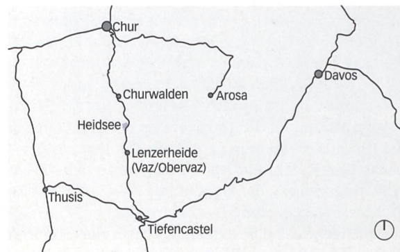
Situation, Mst. 1:500000.

In Sichtweite davon hat das Büro auch den Bushof realisiert, mit ebenso ausgeprägtem Materialisierungscharakter. Die alte Postautohaltestelle an der