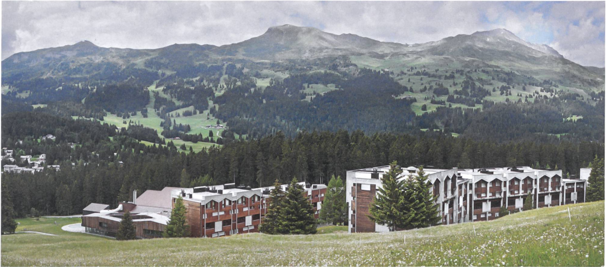
Neue Ferienresorts werden in der Lenzerheide kritisch beäugt. Die rund 40-jährige Feriensiedlung «Soleval» darf dagegen als selbstbewusster Zeitzeuge der alpinen Tourismusarchitektur wahrgenommen werden.

Vis-à-vis bildet die zweiteilige Überbauung «Senda» (Ritter Schumacher), deren Architektur das Dorfbild noch stärker – mit weiten Fensterlaibungen im Sgraffitorahmen und hellen Farben – modernisieren will. Von den chaletartigen Nachbarhäusern wurde das Satteldach übernommen; anstelle der Holzbalkone sind Loggien in die Lochfassade eingezogen worden. Das Erdgeschoss des vorderen Wohnhauses wird als Café genutzt und wendet sich mit Terrasse und Treppe einladend dem Postplatz zu. Die übrigen Einkaufsläden und Hoteladressen liegen an der viel befahrenen Hauptstrasse; für Passanten wird es schnell eng.