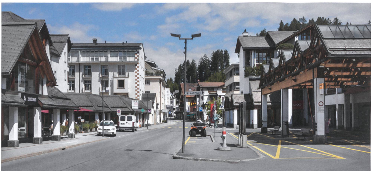
Die Suche nach einem Zentrum und einer Identität (Zentrum von Vaz/Ober vaz): Wie können sich die Standortgemeinde und die Tourismusdestination gegenseitig positiv beeinflussen?

Hartmann) wurde vor drei Jahren bezogen. Die Fassaden vereinen Stein und Glas, und das Dach ist beinahe flach. Das Gebäude ist das Resultat eines Wettbewerbs unter einheimischen Architekten und versucht wie viele andere Neubauten, das vorherrschende Siedlungsbild aus alter, neuer und imitierender Chalet- und Holzarchitektur zu durchbrechen. Auf dem Rundgang mit Architekt Ritter gibt es zudem überraschende Zeitzeugen der alpinen Tourismusarchitektur zu entdecken. Neben dem Schwimmbad zelebriert eine rund 40-jährige Feriensiedlung selbstbewusst den Sichtbeton und die damals vorherrschende kollektive Wachstumseuphorie. Und auch die Jugendherberge ist ein Blickfang; das modernistische und sachliche Gebäude aus den 1930er-Jahren überragt den Villenhügel von Valbella.