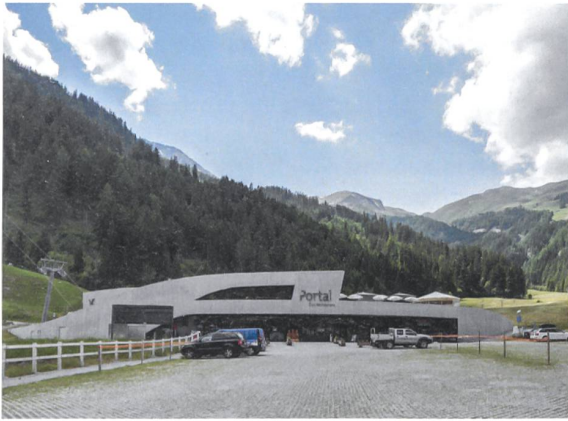
Portal Churwalden: vorgezogener und auffälliger Einstieg in die Feriendestination Lenzerheide (Architektur: Ritter Schumacher, Chur; Bauingenieur: ewp, Chur; Baujahr: 2016).

Hauptstrasse ist durch einen Holzpavillon ersetzt worden; die Konstruktion ist pilzförmig, besitzt Lamellenwände und kragt nach oben aus. Im Innern befinden sich ein geschützter Warteraum sowie ein Migros-Markt. Ursprünglich war ein einfacher Unterstand gedacht; die konzeptionelle Erweiterung und die Zusatznutzung hatten die Architekten ins Spiel gebracht. Geholfen hat, dass Gemeinde und Bahnbetreiber gemeinsam ein übergeordnetes Arealentwicklungskonzept erarbeitet haben. Anstatt weiterhin von der Verkehrslawine überrollt zu werden, kann Churwalden nun darauf hoffen, als Teil der Feriendestination wahrgenommen zu werden und davon selbst mehr zu profitieren.