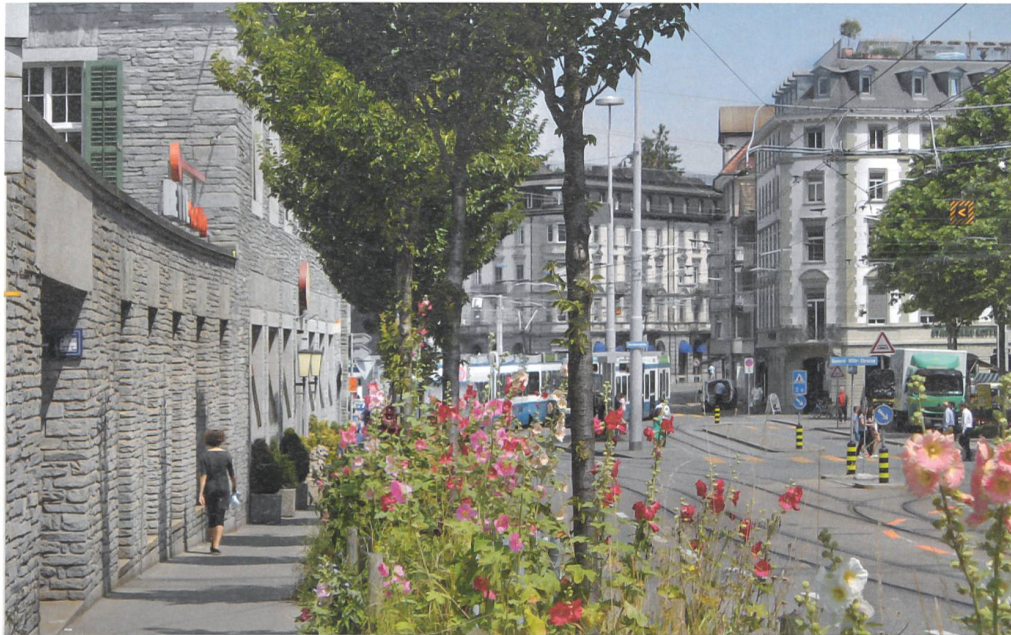
Malvenblüte auf den Baumscheiben vor dem Bahnhof Enge in Zürich, 2014.

stand er auch dafür ein, unter der Devise «Alle brauchen Gärten!» «Gärten in Massen» bereitzustellen. Er schenkte dem Kleinen ebenso viel Aufmerksamkeit wie dem Grossen. Heute sind die grünen Keimzellen noch kleinteiliger: Im omnipräsenten Wachsen und Wuchern von Dächern und Balkonen, bepflanzten Baumscheiben und berankten Wänden potenziert sich Migges Forderung, die Stadt mit Gärten gleichsam zu übersäen.