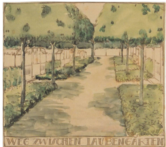
Kolorierte Ansichten für Laubengärten in Berlin-Schöneberg, Leberecht Migge 1918.

schen und zukunftsgerichteten Ansatz, der romantizierenden Gartengedanken wenig Raum lässt. Vom Nutzen bringenden Gartenbau versprach er sich zudem auch eine Steigerung der körperlichen und mentalen Gesundheit, die langfristig positive Auswirkungen auf die Volkswirtschaft haben werde.