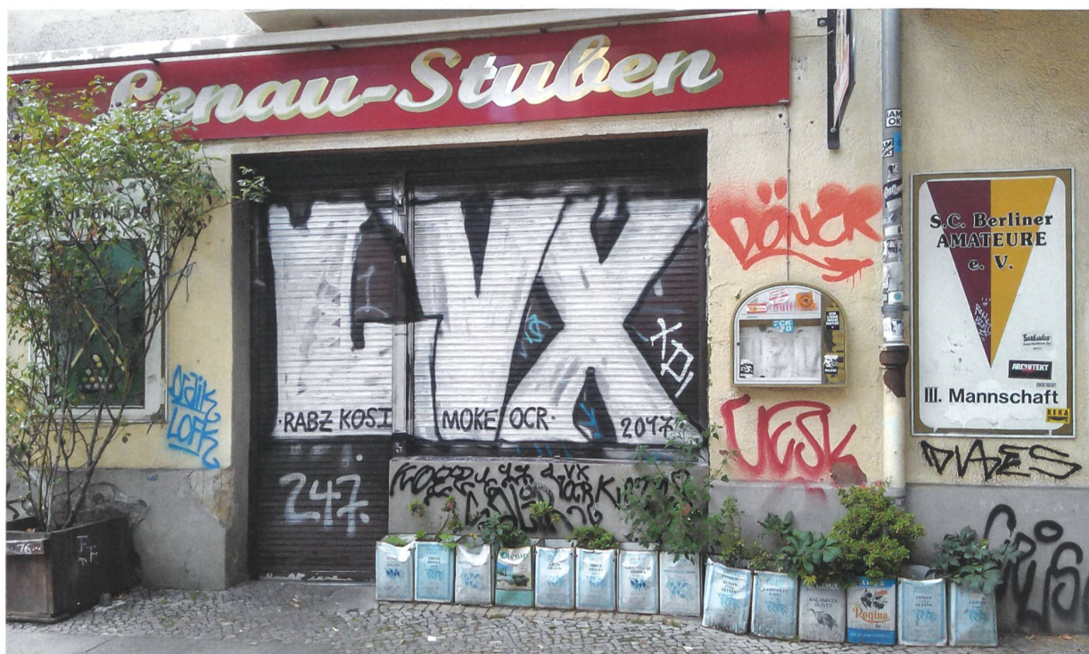
Urban Gardening in Berlin-Neukölln, 2017.

Der Begriff Urban Gardening steht für die gartenbauliche Nutzung städtischer Freiflächen. Dazu zählen auch aktivistische Initiativen, die sich städtischen Raum aus idealistischen Gründen individuell oder als Gruppe aneignen – mit illegalen, temporären, zuweilen aber auch längerfristig angelegten Gärten. Die Bewegung ist facettenreich und umfasst verschiedene Projekte wie Gemeinschaftsgärten, Guerilla Gardening, Dachfarmen, Kinderbauernhöfe, Kleingärten, «essbare Spielplätze», vertikale Landwirtschaft und mobile Gärten. Zwar unterscheiden sich die Ansätze und ihre praktische Ausführung, ihr Hintergrund ist jedoch fast immer partizipativ und gemeinschaftsorientiert.