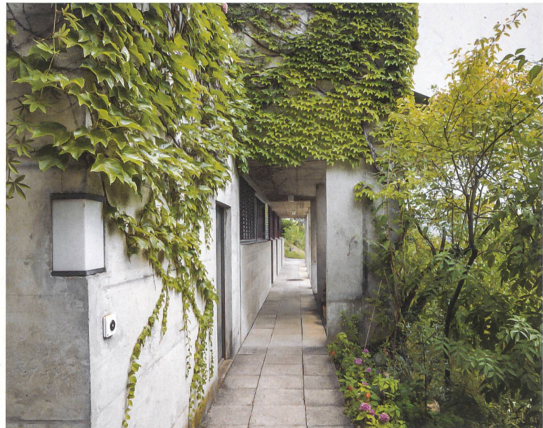
Siedlung Mühlehalde in Umiken, Brugg.