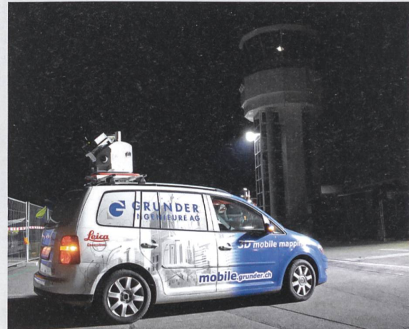
Modernste Vermessungstechnik im Einsatz am Flughafen Bern Belp.

Das einzigartige Aufnahmesystem holt die Realität bzw. die analoge Welt in allen Details digital ins Büro. Das bringt klare Vorteile: Nichts geht vergessen, aufwändige Feldbegehungen entfallen und Nachmessungen vor Ort sind nicht notwendig. Massaufnahmen sind auch zu einem späteren Zeitpunkt jederzeit in der virtuellen Umgebung möglich.