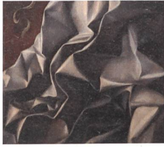
Die präzisen Falten im Gewand des Erzengels Gabriel bewegen sich an der Grenze zwischen Stoff und Architektur. Detail aus Giovanni Bellini und Werkstatt, Verkündigung an Maria, Gallerie dell'Accademia, Venedig um 1490.