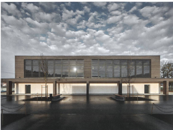
International School of Berne

www.gtsm.ch · info@gtsm.ch · Telefon 044 461 11 30