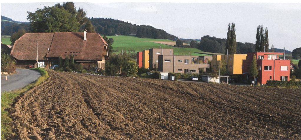
Kulturland, historische Ortskerne, neue Baugebiete und nahebei Wälder für die Erholung – die Raumplanung hat das Ziel, diese Nutzungen und ihre Raumannsprüche nachhaltig und wirkungsvoll in Einklang zu bringen. Ortsbild und Landschaft in Trimmstein bei Bern.

Frank Peter Jäger, Redaktor im Bereich Kommunikation des SIA; frank.jaeger@sia.ch