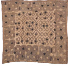
Das Gewebe eines Tuchs kann helfen, komplexe Zusammenhänge zu veranschaulichen, oder es kann als Metapher dienen – zum Beispiel für die Stadt. Abbildung aus der Sammlung des Museo del Tessuto, Prato (1).

In zwei Ausgaben thematisiert TEC21 die mannigfaltige Verwandtschaft von Stoff und Raum. Vorige Woche stand die kunsthistorische und metaphorische Konnotation im Vordergrund. Das nun vorliegende Heft führt weitere Gedanken zur Umsetzung der Stoffmetapher aus.