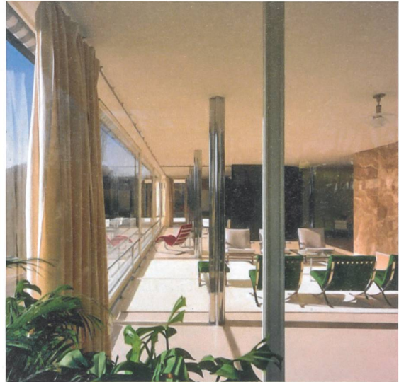
Villa Tugendhat, Mies van der Rohe: Die Materialität zeigt zugleich Reduktion und eine hohes Mass an Sinnlichkeit.

Kriemler: Die Auseinandersetzung mit der Architektur von Fujimoto war einer der Momente, wie ich sie immer wieder erlebe, wenn ich reise. Als ich seinen Serpentine-Pavillon von 2013 in London gesehen habe, war ich fasziniert davon, wie man mit einem weissen Metallstab und ein bisschen Glas so ein wunderbares Gebäude schaffen kann, das nicht nur eine fantastisch fragile, schöne Wolke ist, sondern auch als Pavillon funktioniert. Dieses Überraschungsmoment, wenn eine attraktive