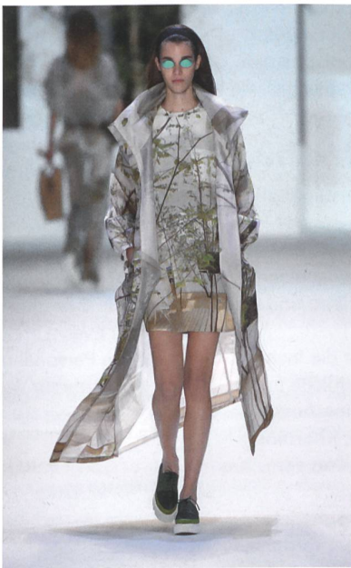
Kleid und Mantel aus der Sou-Fujimoto-Kollektion: Ein Foto des «House N» (von Iwan Baan), wird, grafisch abgewandelt, zum digitalen Fotodruck auf Seide.

Jessen: Genau. Und manchmal beginnt auch bei uns der Entwurf mit einem Material. Am Schaffhauser Rheinweg haben wir mit einem Stück Holz angefangen und sind danach zum Städtebau gekommen. Nicht weil wir uns das vorgenommen haben, sondern weil ich finde, dass das Wohnen am Wasser sich am besten in Holz ausdrückt, vielleicht weil man an ein Boot denkt. Wenn ich morgens barfuss auf meinen Balkon trete, dann ist ein Stück