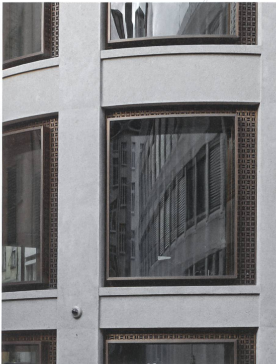
Verwaltungszentrum Oberer Graben, St. Gallen: Die Bronzerahmen der Fenster ziert ein strukturelles Ornament.

Worin gleichen sich für Sie die beiden Disziplinen?