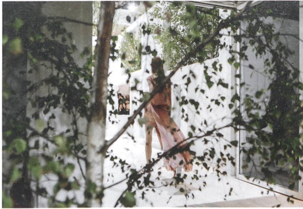
Im Oktober 2015 präsentierte Albert Kriemler seine Kollektion für Frühling/Sommer 2016 in Zusammenarbeit mit dem japanischen Architekten Sou Fujimoto im Grand Palais in Paris.