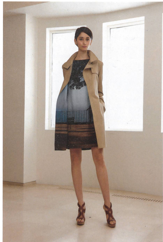
Umsetzung des Fotos in Modedesign: Kleid und Mantelfutter zeigen den digitalen Fotodruck «Bella Vista» originalgetreu.

Sie bauen einen neuen Studiengang für Architektur an der FHS in St. Gallen auf, der im Herbst den Betrieb aufnimmt. Wie lassen Sie dieses Thema dort einfließen?