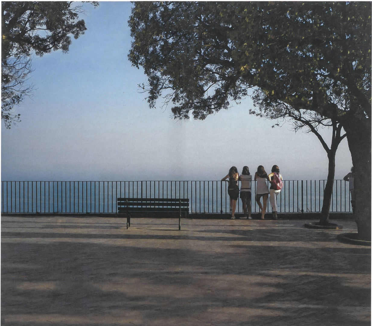
Ein Foto aus dem Buch «In The Spirit Of Capri» war Inspiration und Vorlage für Albert Kriemlers Pionierkollektion Akris Resort 2011, in der zum ersten Mal Fotovorlagen unverändert, auf Stoff gedruckt, in einer Kollektion verwendet wurden (Abb. S. 29).