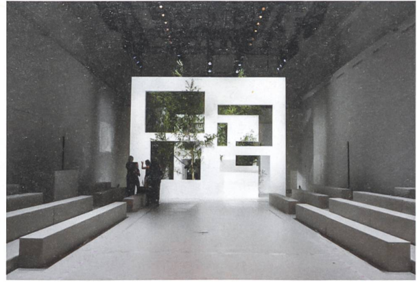
Defilee im Grand Palais, inspiriert von der Architektur von Sou Fujimoto: Die Rekonstruktion seines «House N» wird zur Bühne für den Laufsteg.