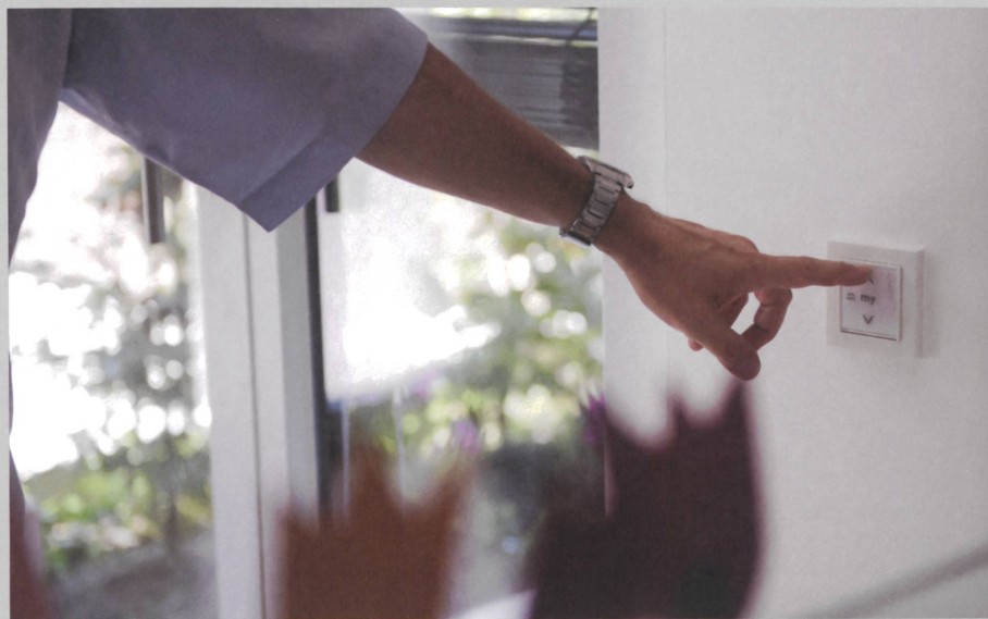
Die lokale Vor-Ort-Steuerung erfolgt ganz komfortabel per Knopfdruck.

Somfy AG Vorbuchenstrasse 17 8303 Bassersdorf www.somfy.ch