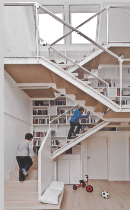
Model Home «LichtAktiv Haus», Hamburg (D).

Auf den ersten Blick scheint die Mehrheit der Schweizer mit ihrem Zuhause sehr zufrieden zu sein. Die genauere Analyse der einschlägigen Faktoren für Wohnkomfort und Wohngesundheit – thermischer Komfort, Lüftung, Tageslicht und Zustand des Gebäudes – zeigen jedoch, dass die psychischen und physiologischen Bedürfnisse vieler Menschen in ihrem Wohnumfeld nicht erfüllt werden. Relevante Bevölkerungsteile empfinden ihre Wohnungen als zu kalt, zu dunkel oder zu stickig. Hinzu kommen grosse spezifische Unterschiede sowohl in den einzelnen Regionen als auch in den verschiedenen Altersklassen der Gebäude. So heben sich zum Beispiel die Regionen Westschweiz und Tessin meist stark vom restlichen Teil der Schweiz ab und nähern sich mit ihren Einschätzungen eher dem europäischen Durchschnitt.