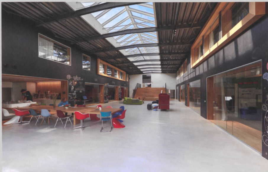
Nutzungsänderung Bahnhof zu Gewerbehallen, München (D).