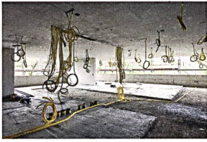
Nur nicht den Überblick verlieren! Die Gebäudetechnik wird immer aufwendiger. Sind wir noch auf dem richtigen Weg?