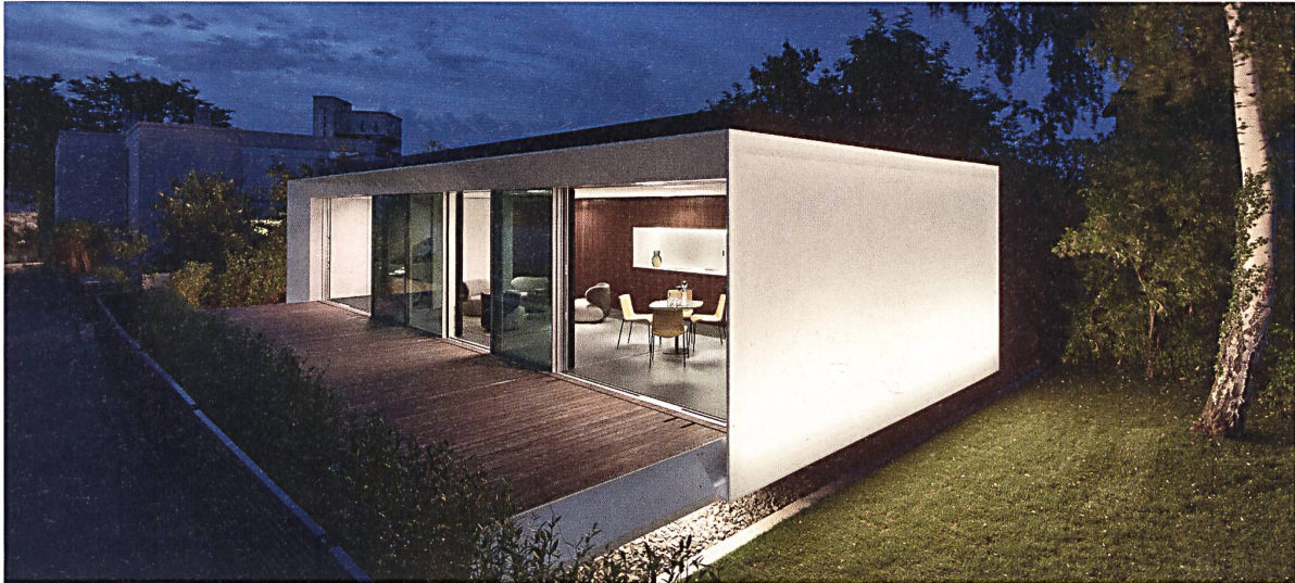
«Mehr tun als nur rechtliche Energievorgaben einhalten»: Ansicht des Aktivhauses B10 in der Stuttgarter Weissenhofsiedlung.

müssen ersetzt- und austauschbar oder so aus dem Gebäude entnehmbar sein, damit sie einem perfekten Recyclingprozess zugeführt werden können. Ziel muss ein ressourcenschonendes Haus sein, das hinsichtlich seiner technischen Komposition – und nur so verstehe ich das – einer Maschine vergleichbar einfach zusammen- und auseinandergebaut werden kann. So weit sind wir im Bauwesen noch lang nicht.