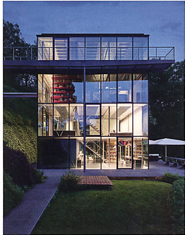
Wohnhaus R128: modularer Aufbau und gesteckte Konstruktionselemente.