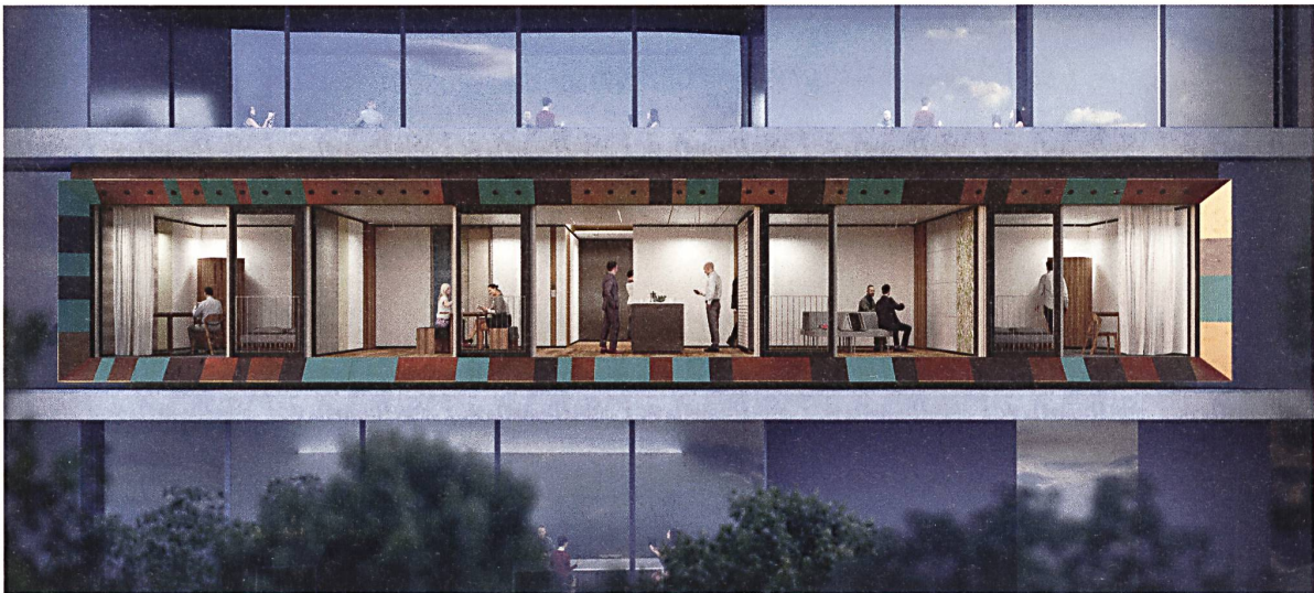
«Urban Mining and Recycling»: Rendering der Front des Forschungsmoduls mit rezyklierten Baustoffen am Empa NEST.

so miteinander verbunden werden können, dass sie allen bauphysikalischen Anforderungen entsprechen, aber dennoch sehr leicht sortenrein zurückgebaut werden können. Die eingesetzten Materialien stammen zu einem grossen Teil aus Recyclingprozessen; und sämtliche Bauteile können zu 100% in technische oder biologische Kreisläufe zurückgeführt werden.