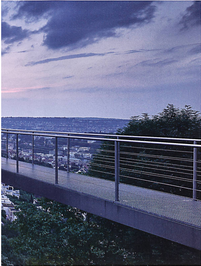
Haus «R128» in Stuttgart: Leichtbau aus Glas und Stahl.