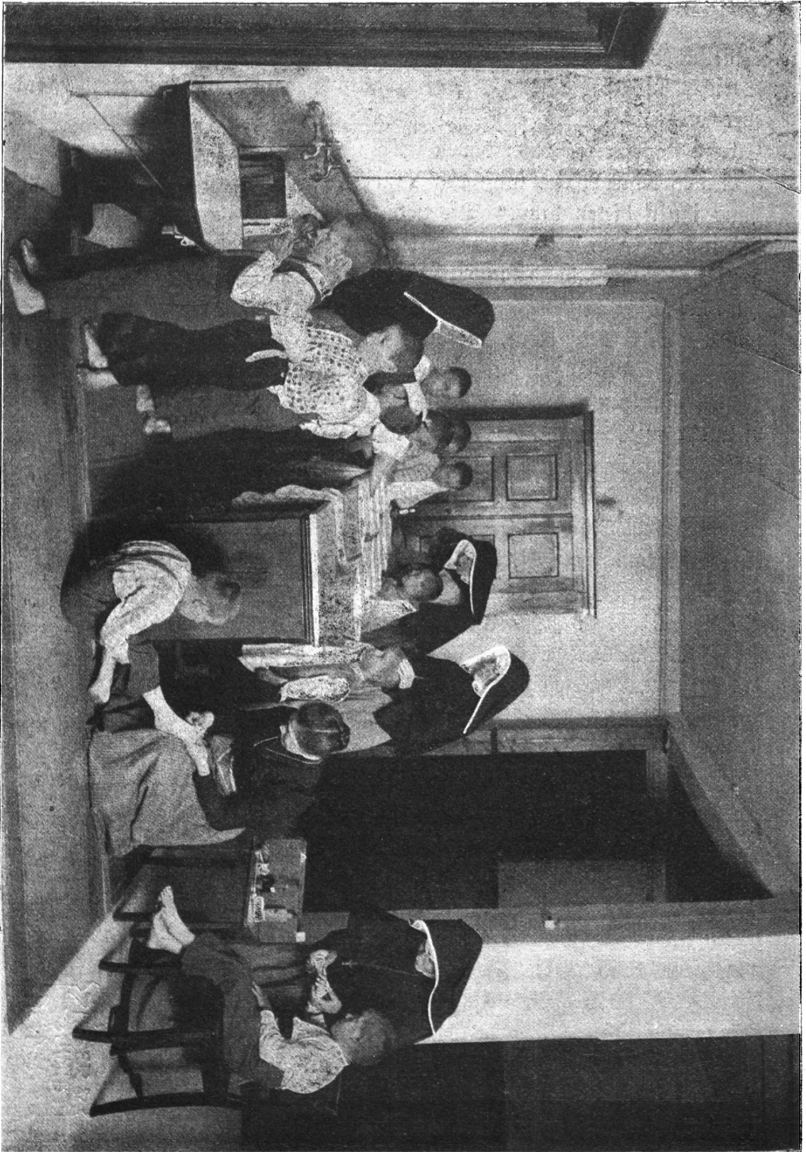
Coilette im Vestibüle und Samarit erdientte.