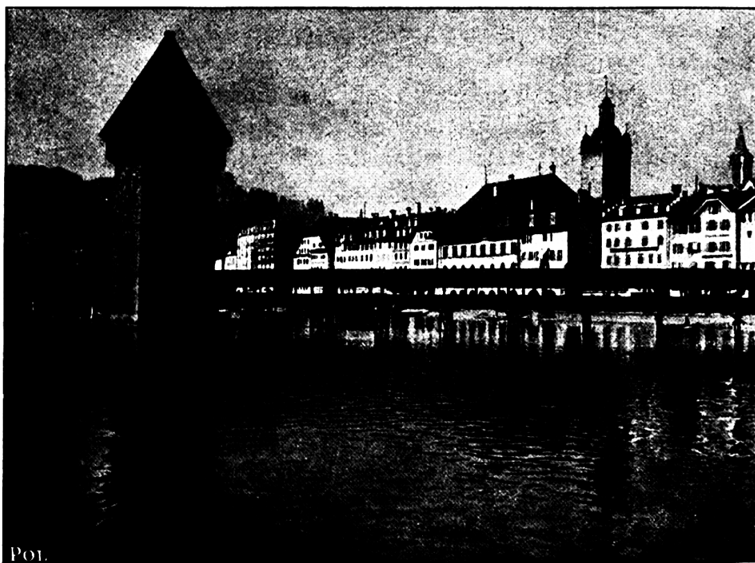
Wasserturm mit Kapellbrücke.