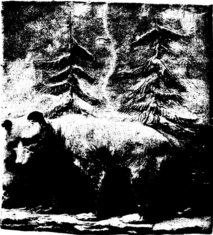
3. Stufe (Knaben von 14–15 Jahren).

für die Seminaristen die Handarbeit obligatorisch zu machen; solange sie aber nicht obligates Schulfach ist, wird dem Wunsche kaum entsprochen werden können. Einsender dies erteilt Unterricht in Knabenhandaarbeit und stets mit größerer Freude. Er begrüßt die Stunden als Abwechslung vom mehr theoretischen Schulunterricht; die Schüler zeigen das regste Interesse. Schon die Gegenstände an sich erwecken ihre Freude, noch mehr aber beglückt das Bewußtsein: „das habe ich selbst erstellt.“ Das trifft übrigens bei uns selber ebenfalls zu. Die Disziplin braucht nicht so starr und eisern zu sein. „In der Freiheit zeigt sich der Charakter.“ Ordnung soll ja sein, aber der Schüler kann sich freier bewegen; es herrscht weniger Zwang, mehr freundl. Unterweisung. Der materielle Gewinn ist für den Lehrer nicht geradezu glänzend; immerhin zahlt der Staat (Et. Gallen) pro Stunde 65 Rp.; welcher Betrag von den meisten Schulgemeinden auf Fr. 1 erhöht wird. Die Schüler zahlen für Werkzeug und Material ca. 5 bis 6 Fr., wovon dem Lehrer noch ein kleines „Bene“ bleibt. Zu erwähnen ist, daß