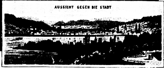
AUSSICHT GEGEN DIE STADT