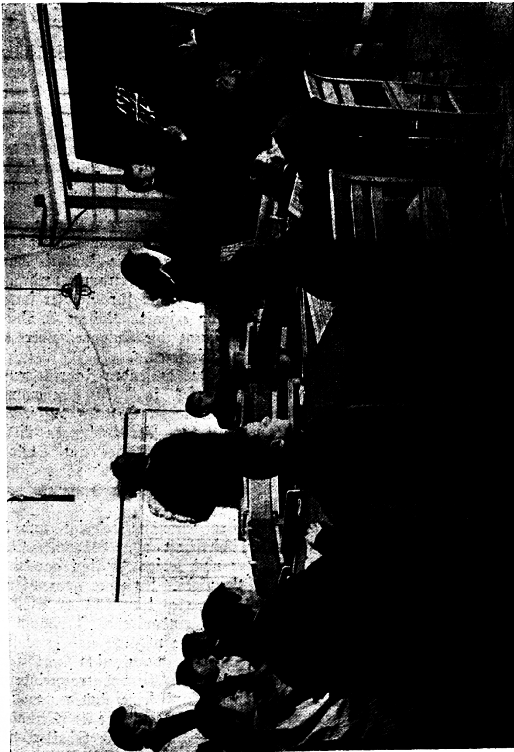
Sohanneum: Klasse der Schwerhörigen.