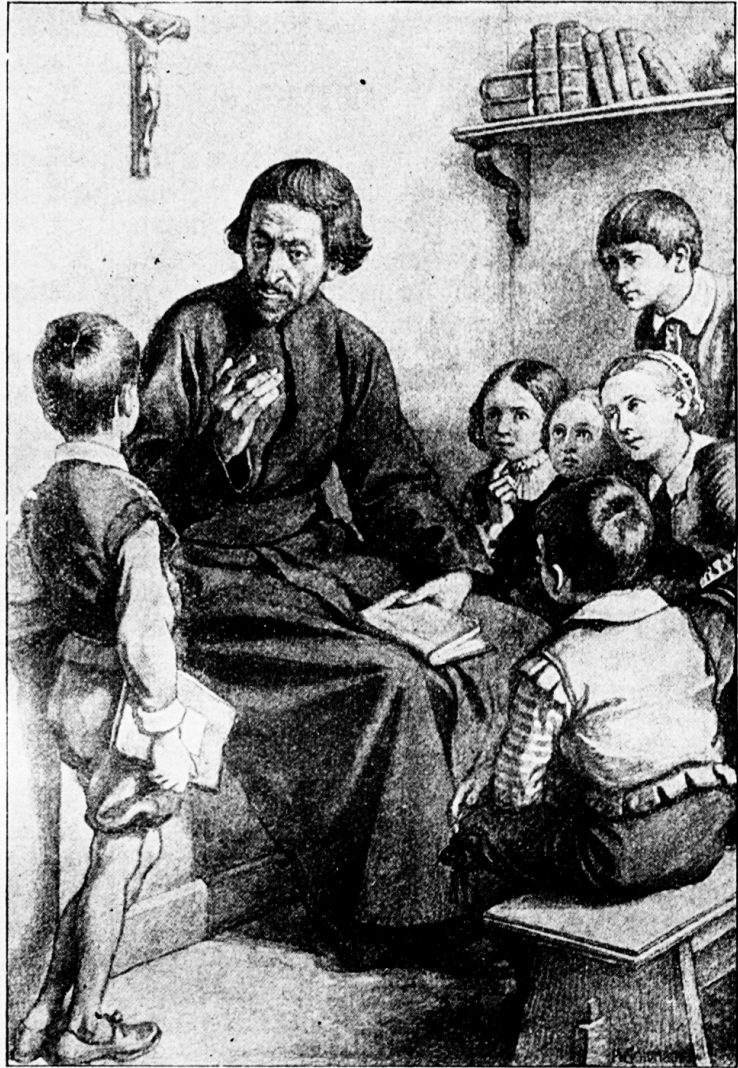
Petrus Canisius unterrichtet die Kinder.