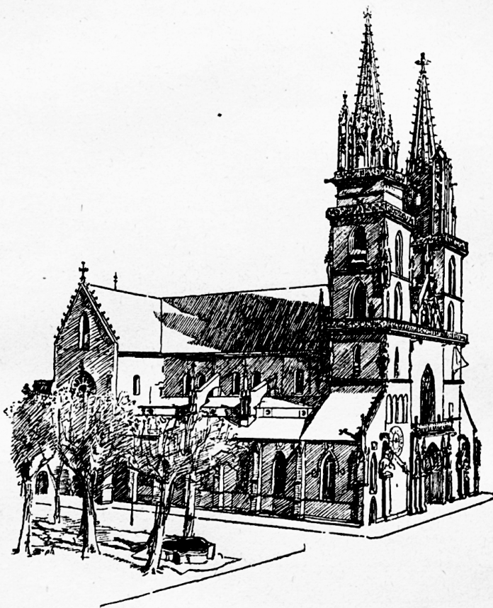
Das Basler Münster. (Nach dem Erdbeben 1356.)

Von katholisch Basel strömte auch in literarischer Hinsicht ein reiches Leben aus. Schon im 13. Jahrhundert treffen wir in Basel den Meister-