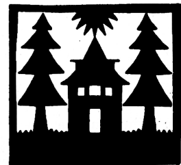
Probe-Illustration aus dem „Mein Freund“ 1931