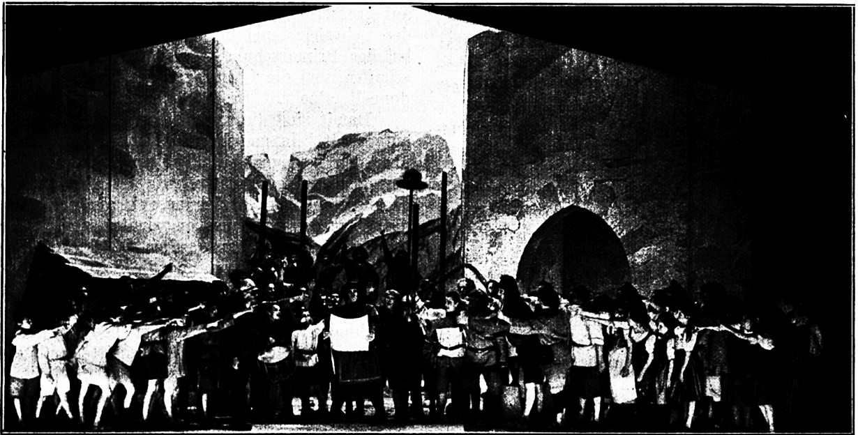
1. Szene aus den Tellspielen in Altdorf

Der nächste Schritt der Entwicklung geht von dieser Simultanbühne , das heisst vom Zerstreuen der