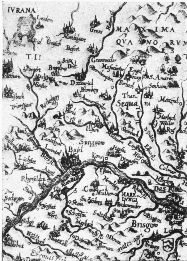
Fig. 2. Linke obere Ecke einer Karte mit der Aufschrift: Abriss ds Reinstroms / welcher gegent zwischen Coblentz und Engers / Marquis Spinola mit Königl: Maystr: in Spanien Kriege Armada übergesetzt / und in Teutschlandt marchirt / desgleichen / wo der Marg-graff von Anspach sich gelagert. etc. Ungef. \frac{3}{4} natürliche Grösse.

tung der Berge von links oben her = Nord-west in Fig. 1 und 3 (die Berge sind Mäusehaufen in Fig. 3, sehr steil in Fig. 2, überaus zierlich in Fig. 1). Die Wälder in Fig. 1 und 2 nicht übersehen!