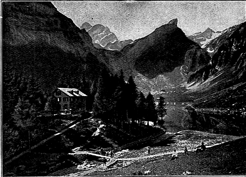
Seealp mit Altmann, Rossmahd und Säntis.