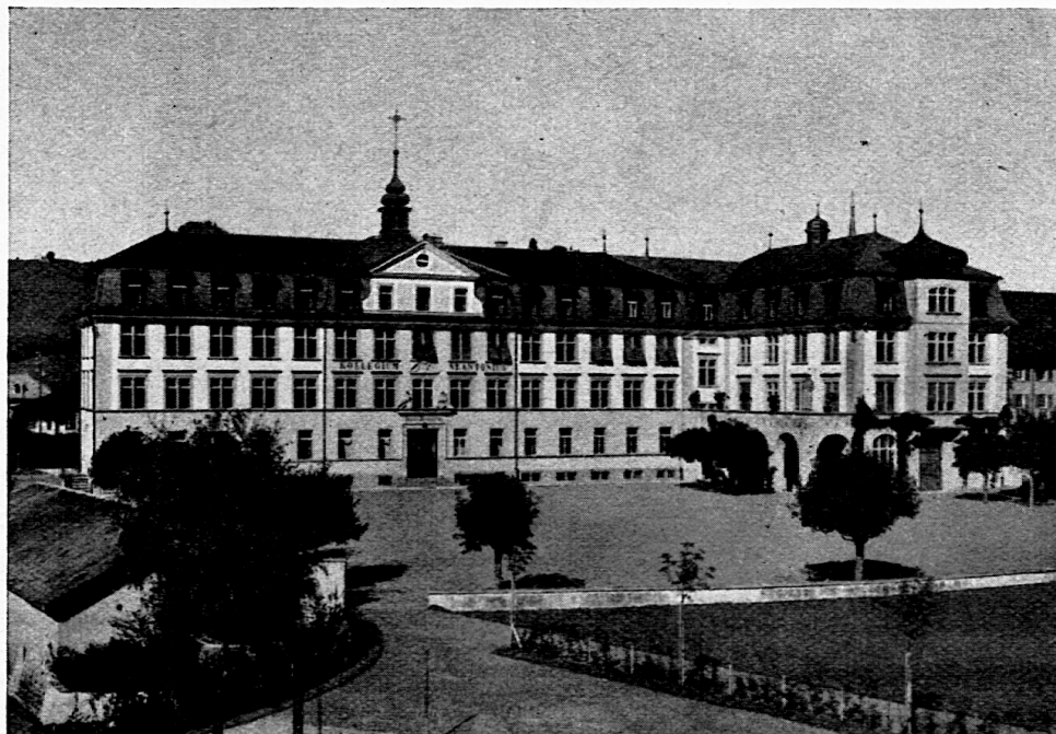
Kollegium St. Antonius

Gewiss ist es mehr als nur Zufall, dass der K. L. V. S. seine 1937er Generalversammlung in unser kleines Land verlegt hat. Man will wohl wieder einmal eintauchen in den Geist, der jenem die Freiheit und Selbständigkeit begründet hat und heute noch munter fortlebt. Ein Staat, sei er gross oder klein, kann ja nur dann gedeihen, wenn er den Geist pflegt, der ihm bei seiner Geburt mitgegeben wurde. Die Völker werden erhalten durch die Kräfte, die sie gross gemacht. Das ist eine Lehre der Weltgeschichte. Von unserer Alpsteinheimat dürfen