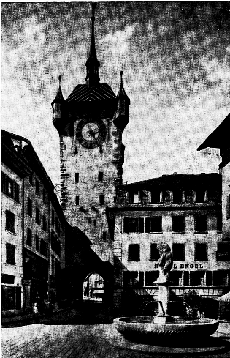
Badens Wahrzeichen, der wehrhafte und vornehme Stadtturm. Davor der Löwenbrunnen, das Werk des Badener Bildhauers Trudel.

Wie anderswo, sind auch im Stadtbilde Badens durch moderne Verkehrsrücksichten, mehr aber durch Unverstand und Interesselosigkeit bemerkenswerte Zeugen der Vergangenheit vernichtet worden. Am meisten zu bedauern ist der 1874 beschlossene und sofort vollzogene Abbruch des „Obern“ oder Mellingerturms, des imposanten Gegenstücks zum sogenannten Bruggerturm. Er gehörte zu den ältesten, vom Stein bis an die Limmat sich ziehenden Befestigungen, die die Stadt gegen Süden sicherten. Stark verändert hat