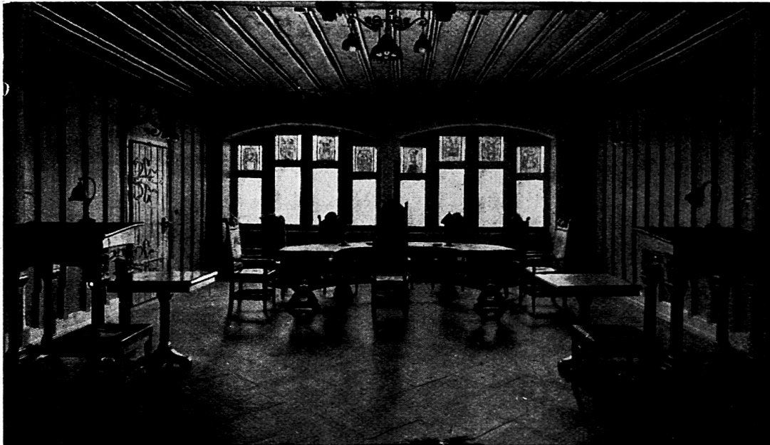
Baden: Der Tagungssaal, worin im Verlaufe von Jahrhunderten folgenschwere Entscheidungen schweizerischer und europäischer Politik fielen.

sich auch das Bild der Bäder, wo 1875 ebenfalls die bemerkenswerte romanische Dreikönigskapelle dem Bau des Grandhotels hat weichen müssen. Eine Zierde der Stadt bleibt der Bruggerturm, der im alten Zürichkrieg 1441 gebaut wurde und vier Jahre später einen Angriff der Zürcher erfolgreich abschlagen half.