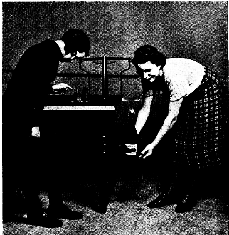
Thurgauer Schulwaage Waagversuch: Wie viel wiegt ein Liter Süssmost?