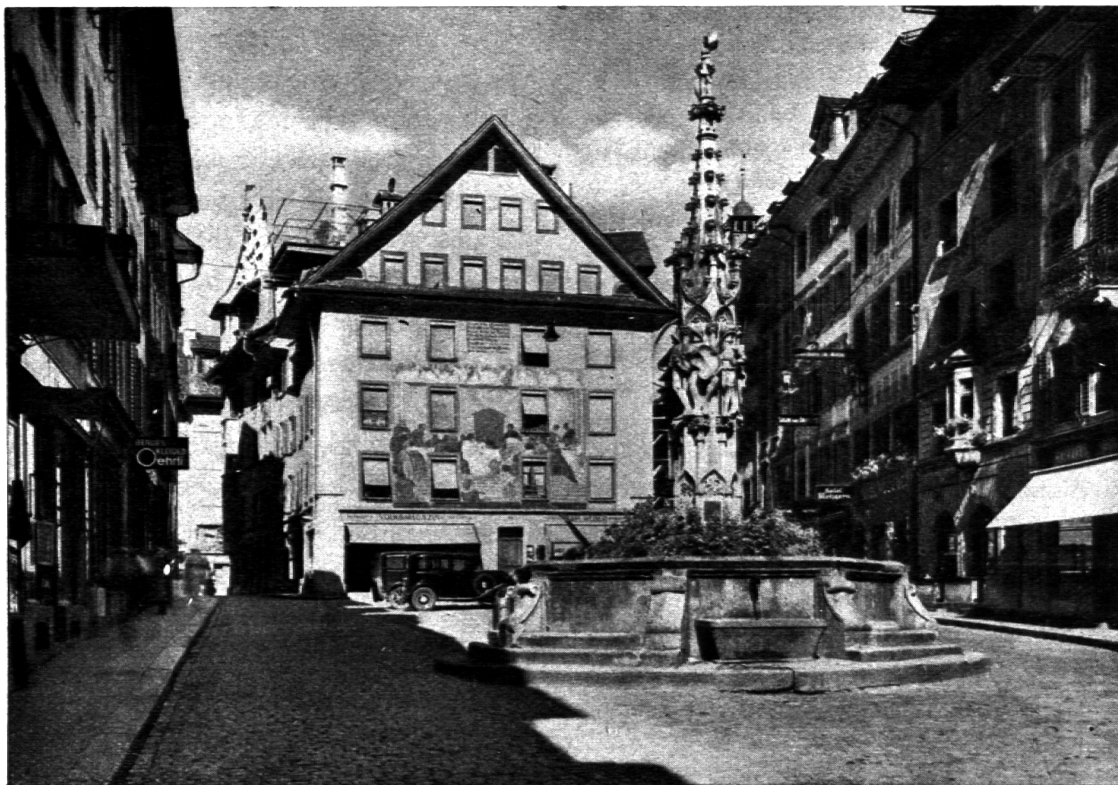
Der Weinmarkt (früher Fischmarkt) mit dem spätgotischen Brunnen von Konrad Luse (Ende des 15. Jahrh.). Hier fanden die berühmten Osterspiele statt, worauf das neue Gemälde von Ed. Renggli (Hochzeit zu Kana) am Haus „zur Sonne“ hinweist.

„Es leuchtet der Grundsatz jedem nicht freiwillig Blinden in die Augen, dass das Erziehungswesen in einer Republik nicht nur die Bildung und das Deko-