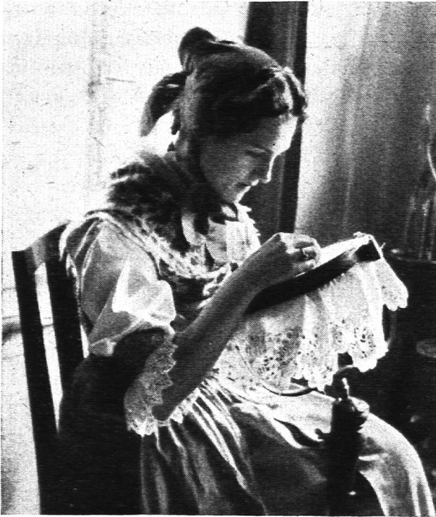
Appenzeller-Stickerin in der alten, schmucken Tracht mit dem roten „Stoffelchäppli“. Kunstgeübte Hand und scharfes Auge schaffen die feinen Nadelgebilde.

Wie offen und ehrlich schreiben diese Kinder! Wie psychologisch fein hat ein Mädchen das Lernen d ü r f e n und dann das Stickenm ü s s e n geschildert! Die übertriebene Kinderarbeit zeitigt bleibende Nachteile. Viele Mädchen sind gesundheitlich geschwächt durch das stete Sitzen in gebeugter Körperhaltung, und manche bleiben im Wachstum zurück. Man könnte vielleicht einwenden, Kinderarbeit sei überhaupt nicht nötig. Das stimmt nicht. Denn die erlesene Feinheit der Stickereien bedingt ein Erlernen von früher Jugend an. 6—8 Jahre Lehrzeit sind vonnöten zur Herstellung künstlerisch einwandfreier Monogramme. Und auch dann hat die Stickerin noch nicht ausgelernt.