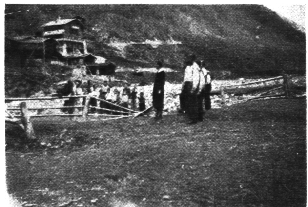
Übungen am Stemmbalken.