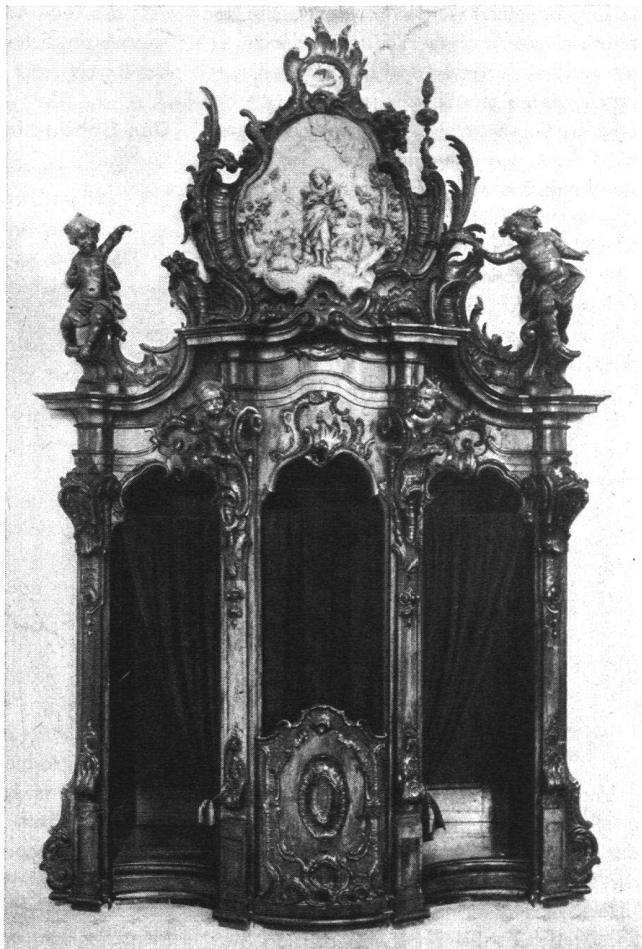
Beichtstuhl aus der Kathedrale St. Gallen

weckte. Das ewige Licht sagt uns, wohin wir den Blick zu richten haben; aber wo Gott thronet, da kann nur Schönheit sein; denn unvereinbar mit dem Göttlichen ist das Unschöne, und gotteslästerlich ist das Hässliche am Orte des Allerheiligsten.