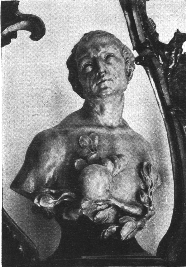
Adam: Detail von einem Beichtstuhl im Kloster St. Gallen

mag er Besitz ergreifen und Gebrauch machen von der Schönheit der Natur, der Steine, der Pflanzen und Tiere und des Geschlechtes, wenn sie nicht im Schutz der Engel und des Heiligen