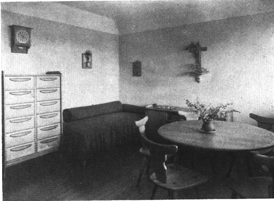
Heimelige Ecke in der Mädchenstube

denfranseln an Eisendrähten als Blumenersatz. Die Wände schmückte man mit billigen Kunstdrucken in pompösen Goldrahmen, seicht sinnliches Geschluder in Rosarot und Himmelblau, und nach Zugabe weiteren Trödlerzeuges war «die schöne Stube» fertig. Erreicht war das Sälönchen der Hausfrau mit den ewig verschlossenen Fensterläden, — dass die Sonne nichts verderbe, — erreicht das Visitenprunkgemach