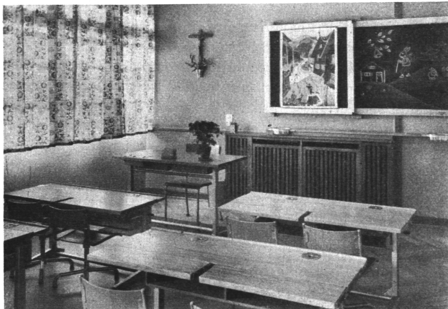
Schulstube in Oberziel

verbannen wir alle unschönen Plakate, werfen wir alle Dinge auf den Scheiterhaufen, die irgendein Merkmal der Reklame sichtbar lassen. Dann aber hängen wir zwei, drei künstlerisch wertvolle Bilder nach Originalen von Schweizer Malern an die Wände. Leicht sind solche heute