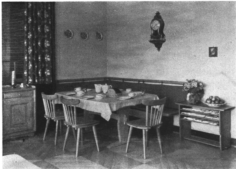
Schöner Winkel im Esszimmer

Um wieviel leichter muss es dazumal gewesen sein, ein Heim zu gestalten, als es noch keine Mode gab, die heute — international und heimatfremd hergeflogen — so viele Köpfe verwirrt und nicht selten zu unglaublichen Torheiten führt. Um wieviel leichter muss es dazumal gewesen sein, sich sein Heim zu gestalten, als noch ein Stil galt, herausgewachsen aus der Gesinnung einer Epoche, ein Stil, reich an künstlerischen Werten und ungemein elastisch in der Anpassungsfähigkeit an die Eigenart des Ortes, an die Persönlichkeit des Einzelnen wie an die Sonderheit der verschiedenen Stände.