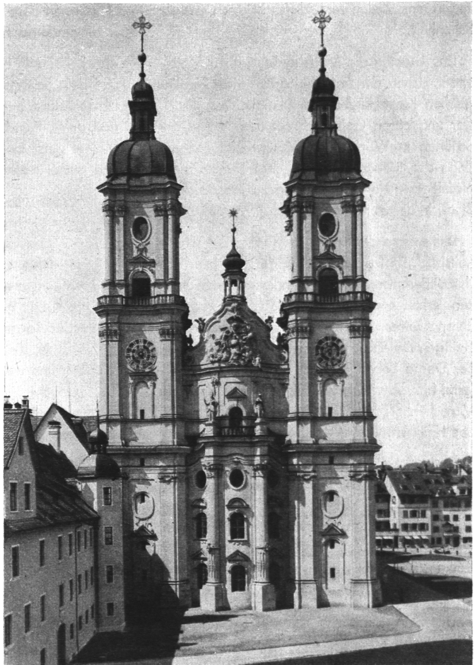
Ostfassade Kloster St. Gallen

ein Traum liegt das Wissen um das Schöne in der Menschenseele. Sie hat es geschaut, ehe sie herniederstieg zur Erde; sie muss es geschaut haben. Was weiss der Mensch davon! Er weiss nur das eine voll und ganz, dass ihn ein unstillbares Sehnen erfüllt und bewegt und durch das Leben begleitet: Das Sehnen nach dem Schönen.