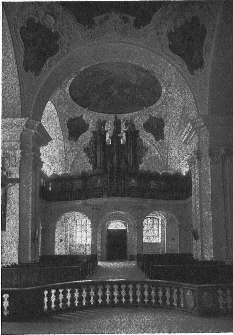
Bild 5 St. Katharinenthal, 1732/36