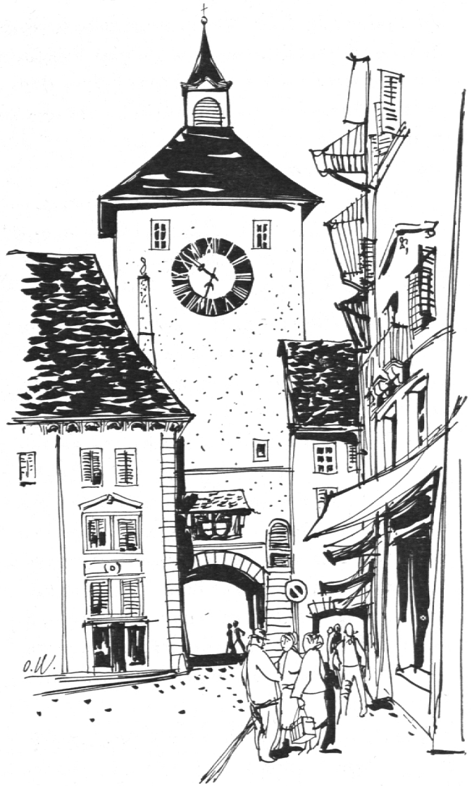
Solothurn, Bieltor von innen. Tuschzeichnung von Prof. O. Wyß

Form, die wir am besten mit einem Vogel vergleichen. Der Kopf liegt im weit abgelegenen Kienberg, der eine Flügel dehnt sich aus gegen Basel und die Burgundische Pforte, der andere gegen die bernische Kornkammer im Fraubrunneramt. Das Rückenmark wird gebildet von der Aare und der Dünnern mit ihren Seitenbächen. Die zähen Knochen sind wohl die markanten fünf Jurakämme, während die feineren Knöchel im Süden hinaus ragen ins bucheggbergische Hügelland oder im Norden zur Burgundischen Pforte. Die Grenzen sind unübersichtlich, Enklaven ragen sogar zur französischen Grenze hinaus. Bernische und basellandschaftliche Gebiete drängen im Birstal weit in natürliche Grenzzüge hinein, und auf der Südseite hat das bernische Bipperamt sogar bis zum Kamm der ersten Jurakette vordrängen können. So kann die Kantonshauptstadt auf Hauptstraße und Bahn von Osten her nur über fremdes Gebiet erreicht werden. Die Ursache dieser Zersplitterung liegt im Kampf um die Selbständigkeit der alten Stadtrepublik Solothurn. Die politischen Bauleute haben ein unfertiges, großangelegtes Gebäude aufgemauert, doch der Ausbau scheiterte am Widerspruch der starken, machtgerigen