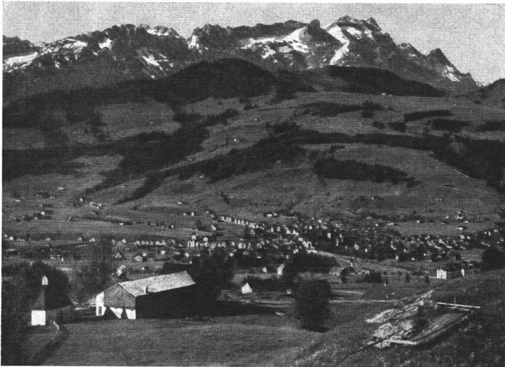
Appenzell, der Tagungsort