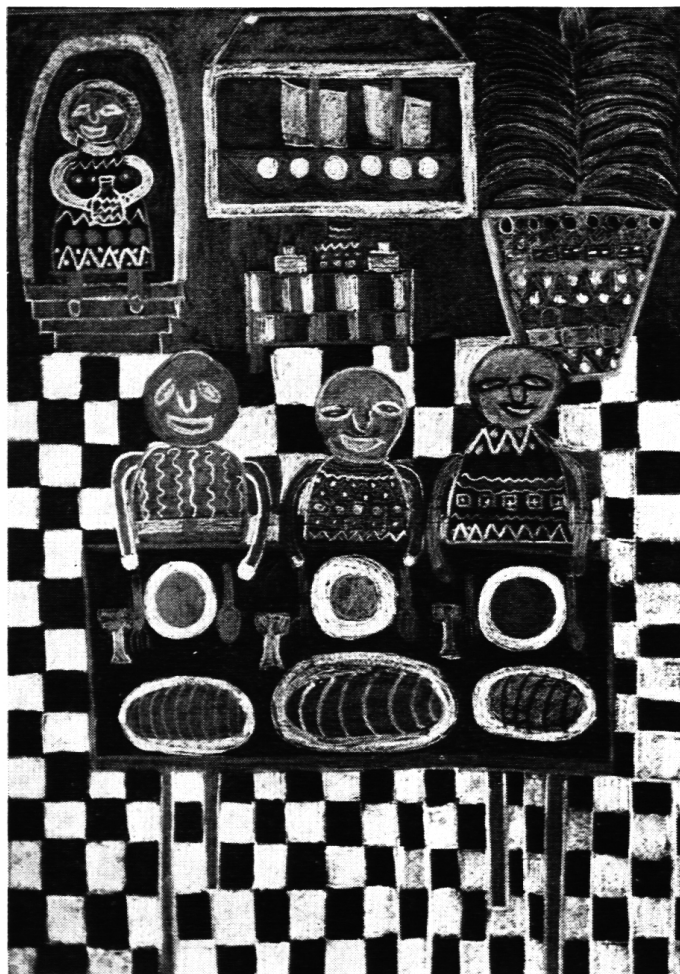
»Emausjünger« evtl. »Hochzeit zu Kana«, Abschlußklasse, Lehrer: Karl Stieger, Rorschach. Material: Farbkreide, schwarzes glattes Papier.

Zum Schlusse möchte ich noch einmal allen, die die Ausstellung mitgestalten halfen, den Ausstellern und der Ausstellungsequipe, der Auswahlkommission, den Führerinnen und Führern durch die Ausstellung, für ihre große Mitarbeit herzlich danken. Sie haben mitgeholfen, daß viele beglückt nach Hause kehrten und daß vielerorts trotz gelegentlicher kleiner Dornen doch eine reiche Saat aufgehen kann.