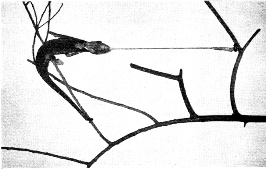
Die Zunge eines Chamäleons schießt hervor, um eine Fliege zu fangen.

ten Fliegen unbeweglich sitzen blieben, merkten die Fische sehr bald, daß sie genarrt worden waren und hörten daher mit ihrer Schießerei schnell wieder auf. Wurde später ein lebendes Insekt neben das angeklebte gebracht, wußten die Fische noch sehr genau, welches die unerreichbare Beute war.