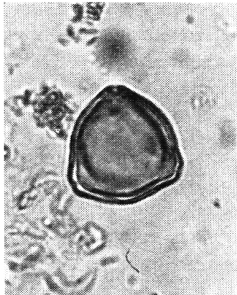
Pollenkorn von Corylus Avellana (Haselstrauch) Natürliche Größe: 24 Mikron, Vergrößerung 740×.

lionen erhalten. Jährlich setzt sich ein Blütenstaubregen in Seen, Mooren oder Lehmen ab. Vorausgesetzt, daß das Medium nicht austrocknet, bleiben die Pollen erhalten. Seekreide, Seebodenlehm oder Torfe enthalten sehr viele Pollen, Sande oder Mergel etwas weniger. Gelingt es nun, die Pollen, welche im Sediment verteilt sind, sichtbar zu machen, so kann eine Artenstatistik das Bild der Vegetation zur Zeit der Bildung des betreffenden Sedimentes ermitteln. Entnimmt man die Sedimentproben vertikal übereinander in bestimmten Abständen, erhält man den ganzen Ablauf der Vegetationsentwicklung. Solche Proben werden bei Bohrungen oder in Baugruben entnommen. Bei der Seekreide von schweizerischen Seen entspricht ein Probenabstand von 10 cm ca. 100 Jahren. Bei diesem Intervall kann man also bereits Veränderungen in der Pflanzenwelt, und damit auch im Klima, feststellen. Da die Pollen mikroskopisch klein sind (einige Mikron bis 150 Mikron), muß ihre Bestimmung im Mikroskop erfolgen. Auf die sehr komplizierte Präparation der Sedimente, um die Pollen sichtbar zu machen, soll hier nicht eingegangen werden.