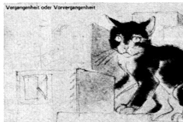
Der blinde Passagier

Drei Mappen mit Übungen zu Artwort, Begleiter, Stellvertreter und Restgruppe erscheinen Mitte 76