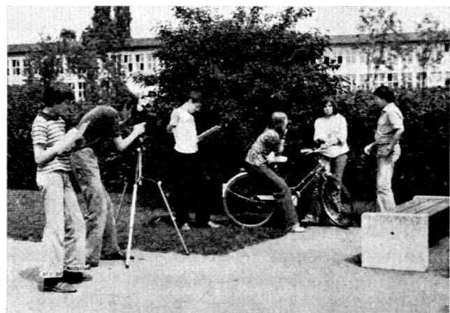
Eine Schülergruppe bei der Filmarbeit. Von links nach rechts: Der Protokollführer, der Kameramann mit Kamera und Stativ, der Regisseur, drei Spieler.

Am Filmtag werden die Szenen nach dem vorbereiteten Plan gedreht. Dieser Teil des Projektes klappt nur, wenn alles genau vorbereitet und auch vorhanden ist (Spieler, Requisiten, Filmmaterial). Fällt ein Teil aus, ist das Ganze gefährdet. Das Besondere an der Filmarbeit ist ja, dass die Szenen nicht in der Reihenfolge gedreht werden müssen, wie sie nachher im Film zu sehen sind. Die Arbeit kann also auf mehrere Tage verteilt werden. Eventuell ist es auch günstig, den Film in einer zusammenhängenden Zeitspanne, z. B. in einem Klassenlager oder einer Projektwoche, zu drehen. Um Filmmaterial zu sparen, wird die Szene vor dem Film mit allen Einstellungen geprobt. Wahrscheinlich kann eine einzelne Szene aus Kostengründen höchstens ein- bis zweimal aufgenommen werden. Als Kameraleute amten der Lehrer und begabte Schüler. Ein Regisseur leitet die Aufnahmen. Ein Schüler führt das Protokoll über die aufgenommenen Szenen.