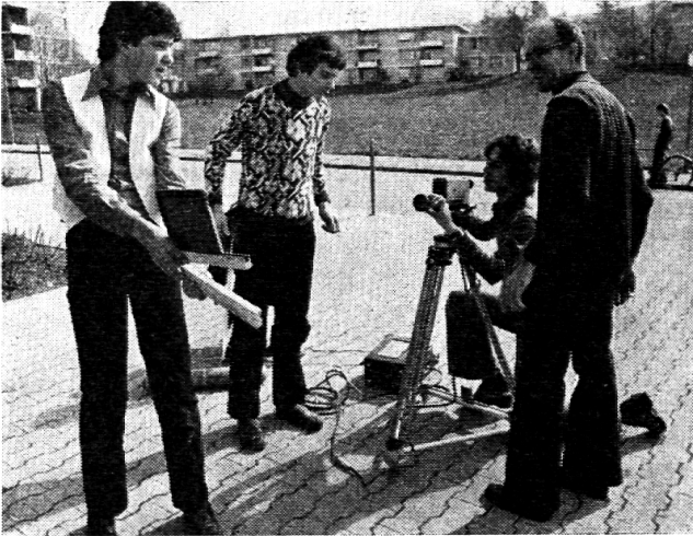
Das Aufnahmeteam vor dem Schulhaus

versucht, ihre eigenen Probleme, ihre Ideen und Gedanken ins Bild umzusetzen. Mit bescheidenem technischem und personellem Aufwand ist ihnen eine eindrückliche Fernsehproduktion gelungen, mit der sie im Sinne haben, hausieren zu gehen. Das heisst, sie wollen ihre Arbeit in kleinen Gruppen persönlich vorführen und zur Diskussion stellen. Bereits haben sich zahlreiche Institutionen und Gruppen dafür interessiert, so unter anderen: das Pestalozzianum Zürich, das Oberseminar Zürich, ein Kurs für Tageschulen auf Boldern sowie diverse Lehrerfortbildungskurse.