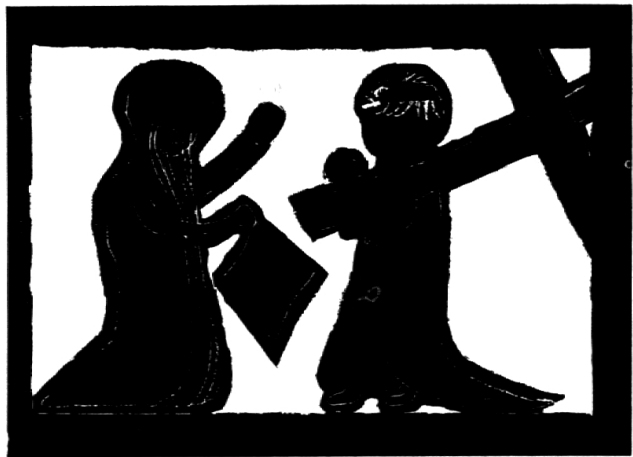
Veronika reicht Jesus das Schweisstuch