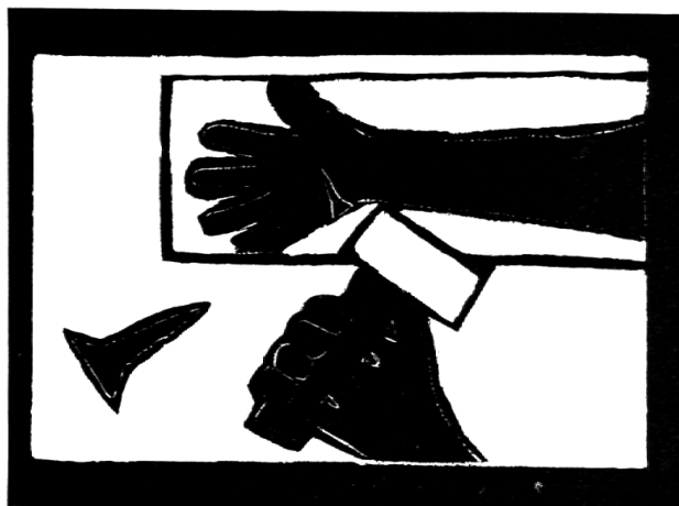
Jesus wird ans Kreuz genagelt

V Sie haben meine Hände und Füsse durchbohrt, sie haben alle meine Gebeine gezählt.