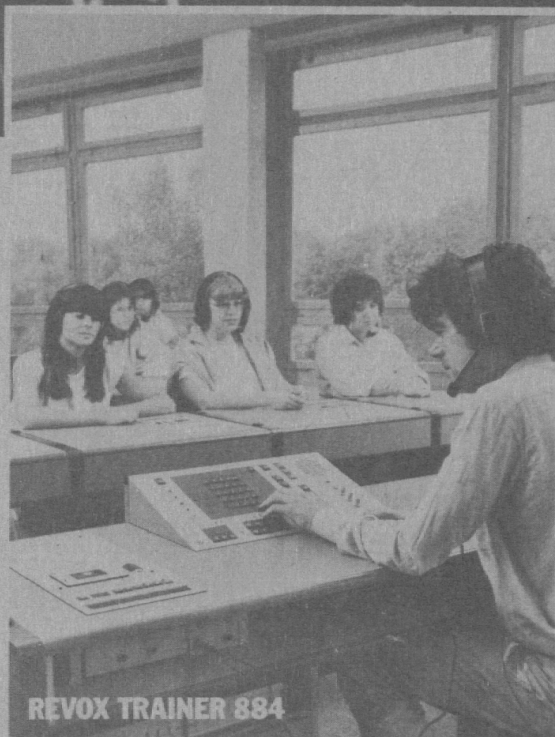
REVOX TRAINER 884

Umfangreiche technische Möglichkeiten und gleichzeitig funktionelle Klarheit der Bedienung waren bis anhin kontroverse Wünsche an eine AAC-Sprachlehranlage. REVOX hat das geändert. Mit hochentwickelter Computertechnik haben wir die Intelligenz der Steuerung dezentralisiert und so das Lehrerpult von unnötigem Ballast befreit.