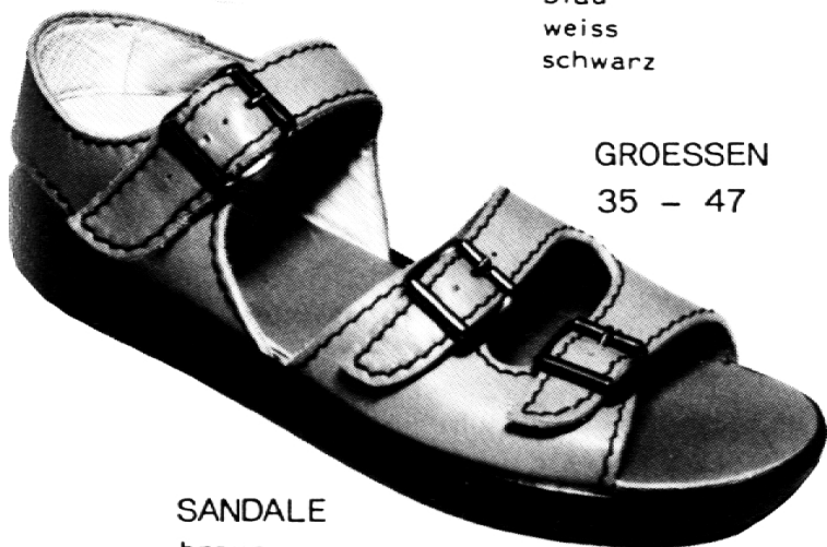
SANDALE braun weiss