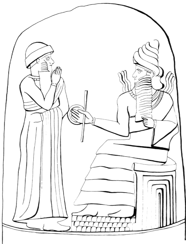
Abb. 4: Hammurapi hat sich darstellen lassen, wie er unmittelbar durch den babylonischen Schöpfergott Marduk (nach Meinung anderer Forscher der Sonnengott Schamasch) als Gesetzesmittler beauftragt wird.

Die Weisungen, die uns in Ex 20,1–17 und Dtn 5,6–21 überliefert sind, werden nicht durchgezählt. Aber aus Dtn 4,13 und 10,4 geht hervor, dass man die Reihe als «Zehn-Worte» bezeichnete. Daraus ergibt sich, dass man das Bilderverbot als eine eigene Weisung betrachtete. Zudem hat man in Dtn 5 das Begehrensverbot trotz der Aufspaltung als eines gefasst. Die altkirchliche Tradition hat sich aber in der