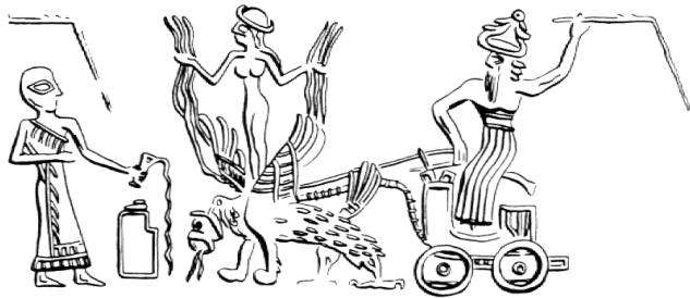
Abb. 3: Der Gewittergott Adad (entspricht Baal) fährt in einem schweren, vierräderigen Wagen donnernd über das Himmelsgewölbe. Seine Peitsche ist der Blitz. Sein Wagen wird von einem Ungetier gezogen. Über dem Ungeheuer steht eine Göttin mit Regenstrahlen in den beiden Händen. Sie verkörpern den freundlichen Aspekt des Gewitters, den fruchtbringenden Regen.

Auch wenn wir diese Naturphänomene (Vulkanausbruch, Gewitter) kennen, müssen wir wissen, dass die Rede von aussergewöhnlichen Naturereignissen in der Sinaierzählung und in vielen anderen Texten der Bibel als Ausdrucksmittel dient, um ein besonderes Wirken und Erfahrbarwerden Gottes zu bezeugen. Darin liegt die Wirklichkeit und Wahrheit solcher Berichte. Diese Überlegungen können Hinweise für die Interpretation vieler Texte des Alten und Neuen Testaments geben.