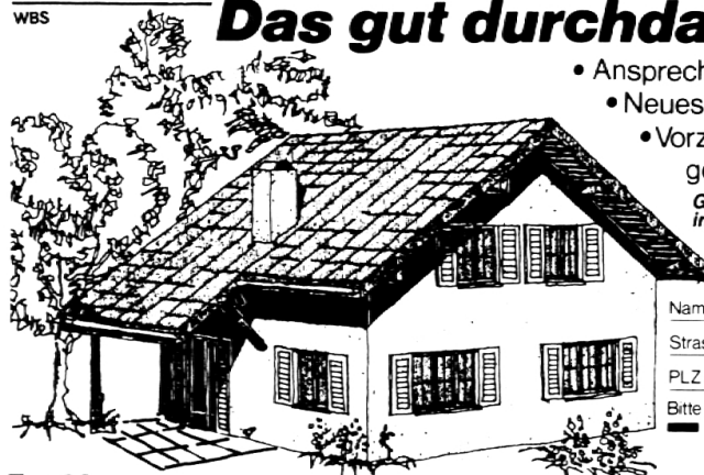
Typ 82 5 1/2 Zimmer

Bitte einsenden an: Marty Wohnbau AG, 9500 Wil