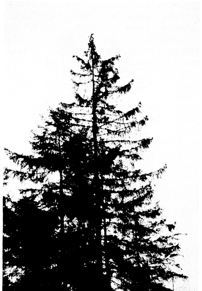
3 Krone einer stark immissionsgeschädigten Rottanne