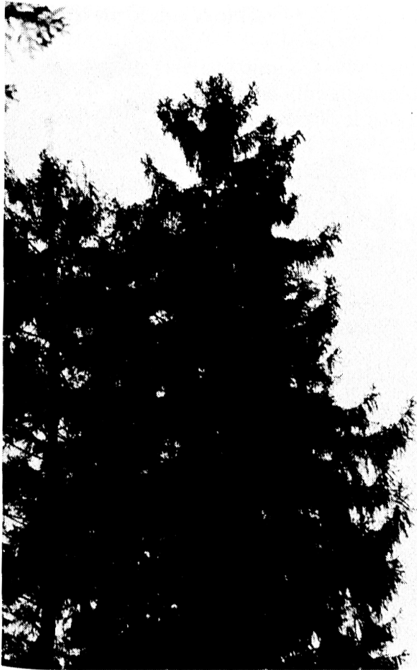
2 Krone einer gesunden, kräftigen Rottanne