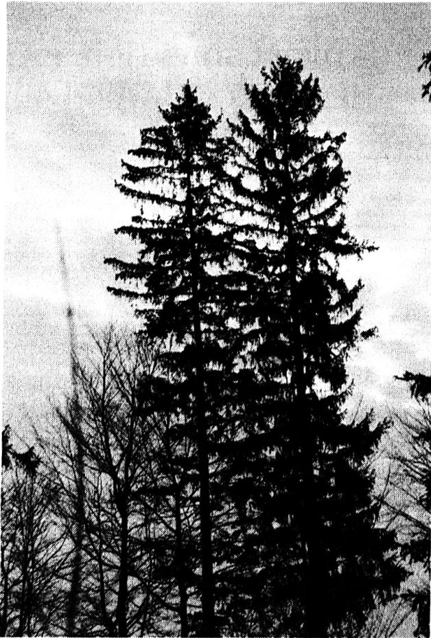
4 Immissionsgeschädigte Rottannen; deutliche Lamettastruktur