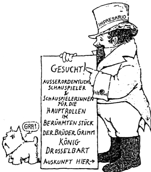
König Drosselbart , Ein Märchen der Brüder Grimm mit Zeichnungen und einer Rahmengeschichte von Maurice Sendak, Zürich: Diogenes 1974.