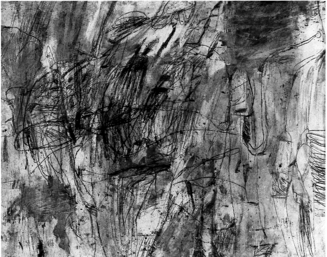
Abb. 3: Cy Twombly, «Untitled», 1954, (New York City), Kat. No. 2, Öl, Kreide und Bleistift auf Leinwand, 174,5 × 218,5 cm.

grossen Formaten, «Schulwandtafeln», die Räume mit den weissen Objekten.