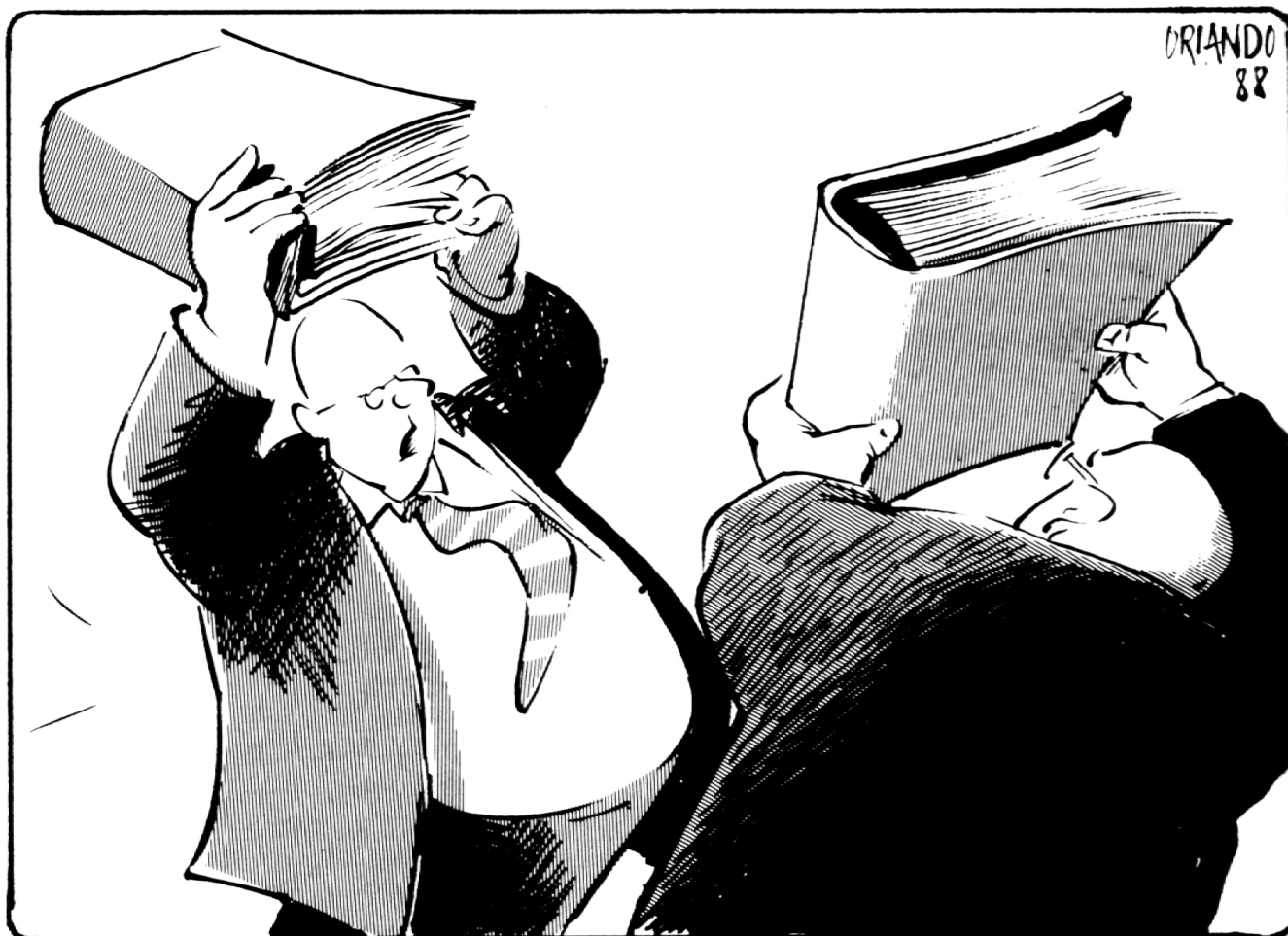
Bildungsstreit (Oder: «Laien contra Profis»)

Schlechte Noten erhält insbesondere die «lokale Laienkontrolle» in der Schweiz, welcher eine professionalisierte und am Beamtentum organisierte Fachaufsicht in Deutschland gegenübergestellt wird. Denn der starke Einfluss von Laien sei eher ein Hindernis, wenn es darum gehe, neue Tech-