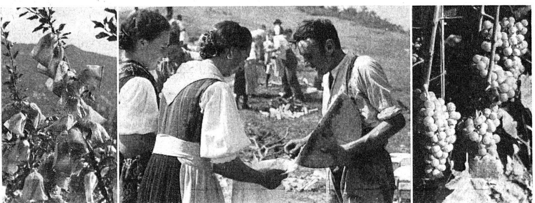
Schutz hochwertiger Aepfel vor Schorf etc. La Sarvaz